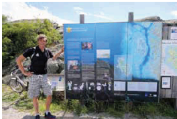
Educatiepaneel bij Kosterhavet..'

op twintig meter van elkaar. Er staat op wat er aan onderwaterleven te zien is. Dankzij de plaatjes en met wat fantasie zijn de Zweedse teksten ook voor ons te begrijpen. Op een speelse manier leren we zo iets over de diversiteit en bijzonderheid van de natuur.