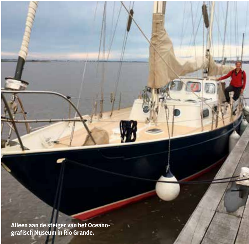
Alleen aan de steiger van het Oceanografisch Museum in Rio Grande.