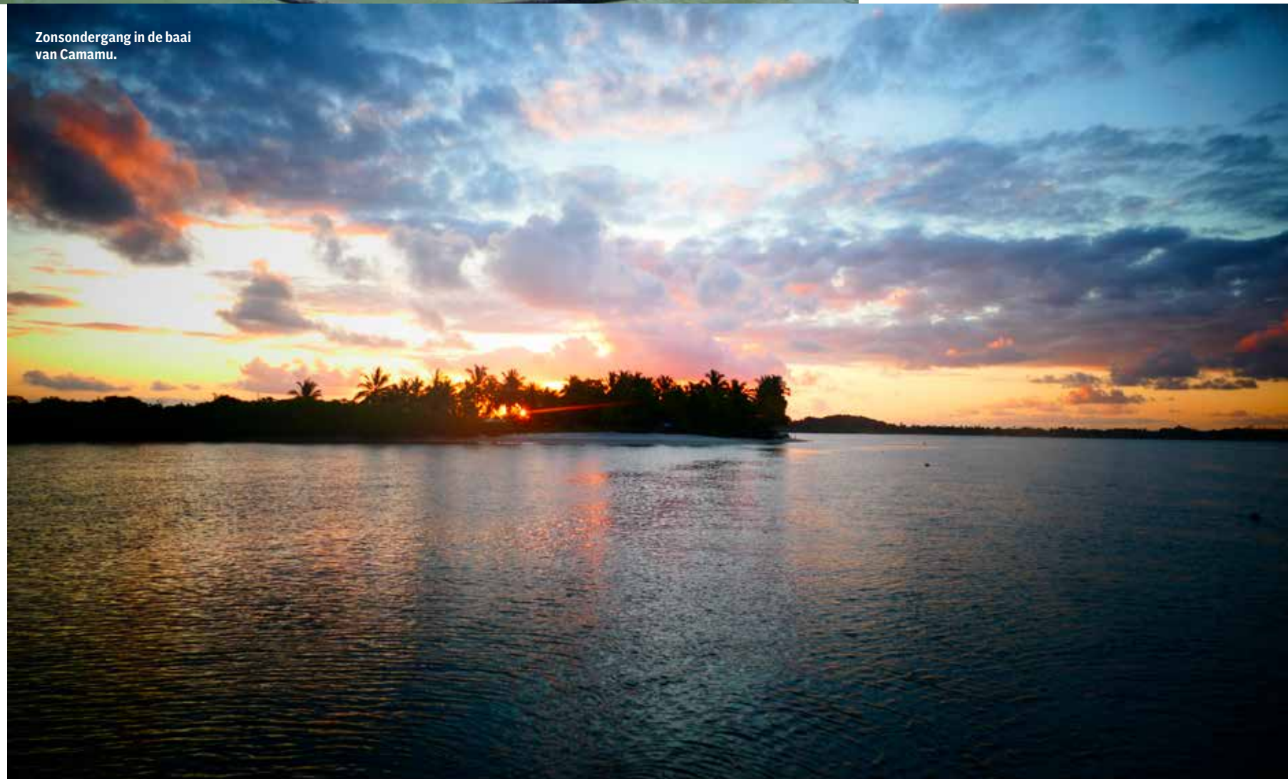
Zonsondergang in de baai van Camamu.

stuk land. De vele grassen, planten en bomen die hij plantte, leidden tot meer regenval, insecten en vogels. Hij herstelde het ecosysteem met inheemse planten en bomen in drie lagen: hoge mahoniebomen boven citrusfruitbomen met daaronder cacaobomen, papaja, banaan, maïs en groenten. Door veel te snoeien en de biomassa op de grond achter te laten, verrijkt hij de grond, terwijl de gesnoeide bomen in verhoogd tempo groeien. Zo werkt hij samen met het bos en gebruikt hij dus geen landbouwgif of kunstmest.