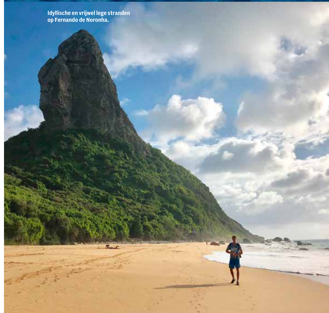
Idyllische en vrijwel lege stranden op Fernando de Noronha.