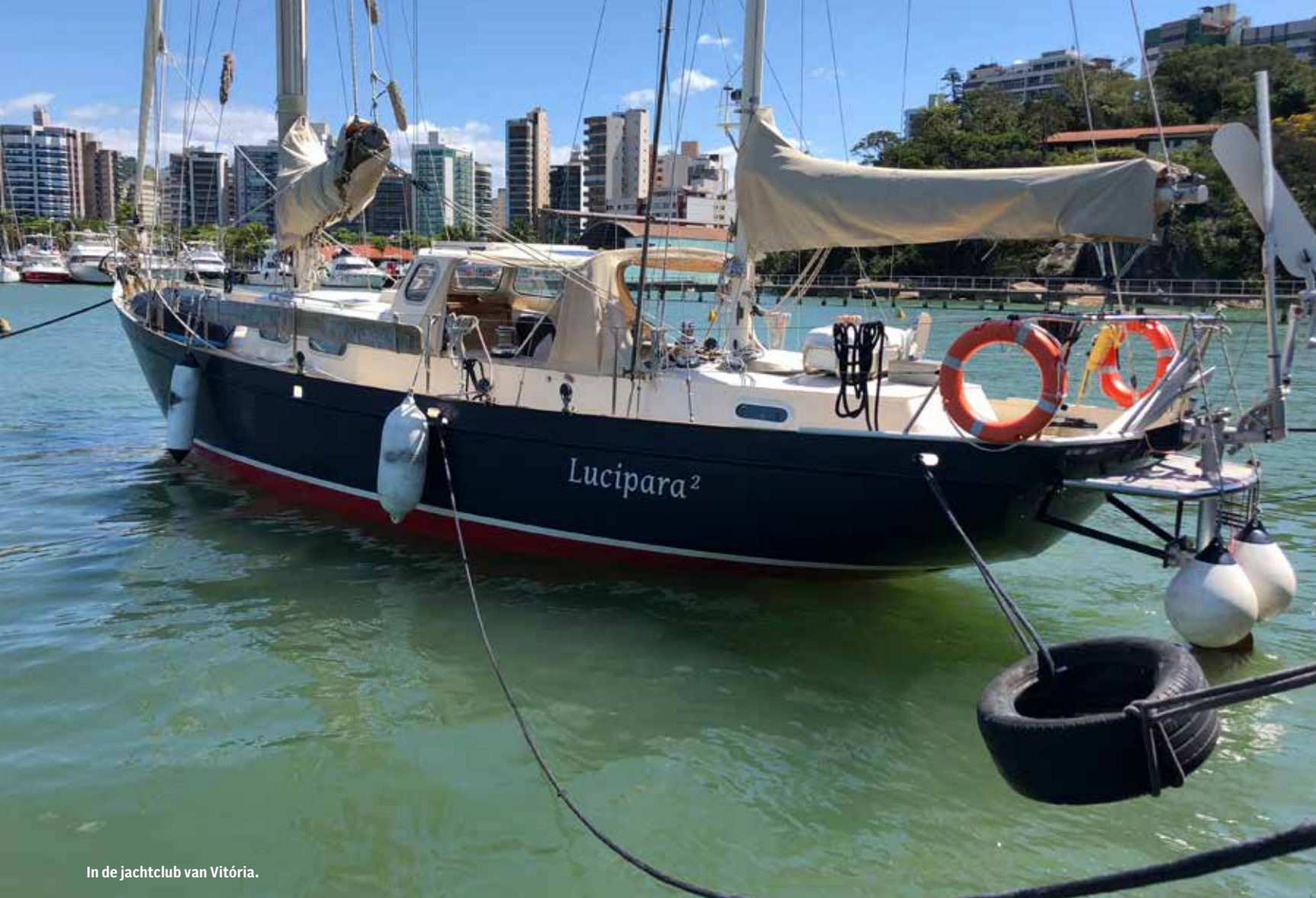
In de jachtclub van Vitória.