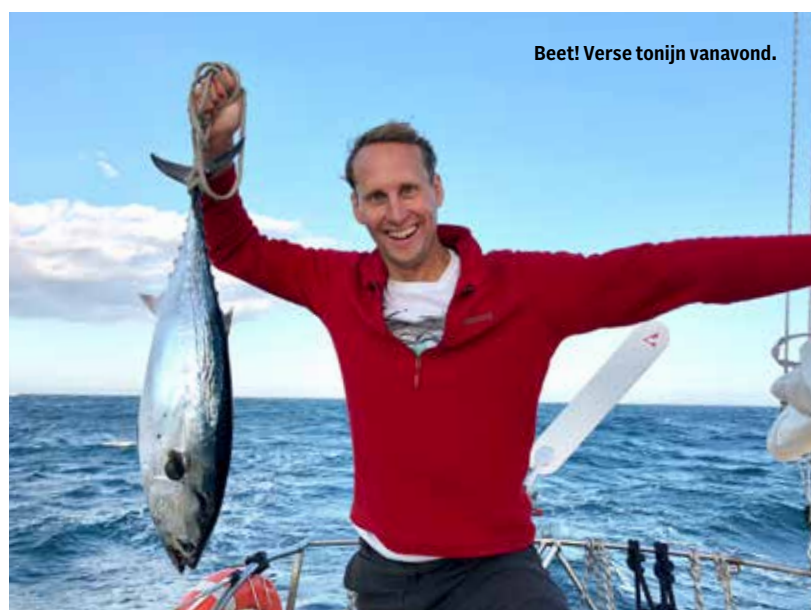
Beet! Verse tonijn vanavond.