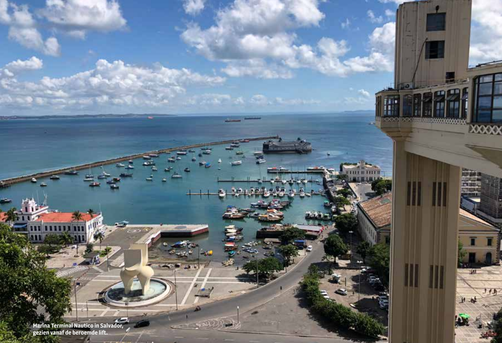
Marina Terminal Nautico in Salvador, gezien vanaf de beroemde lift.