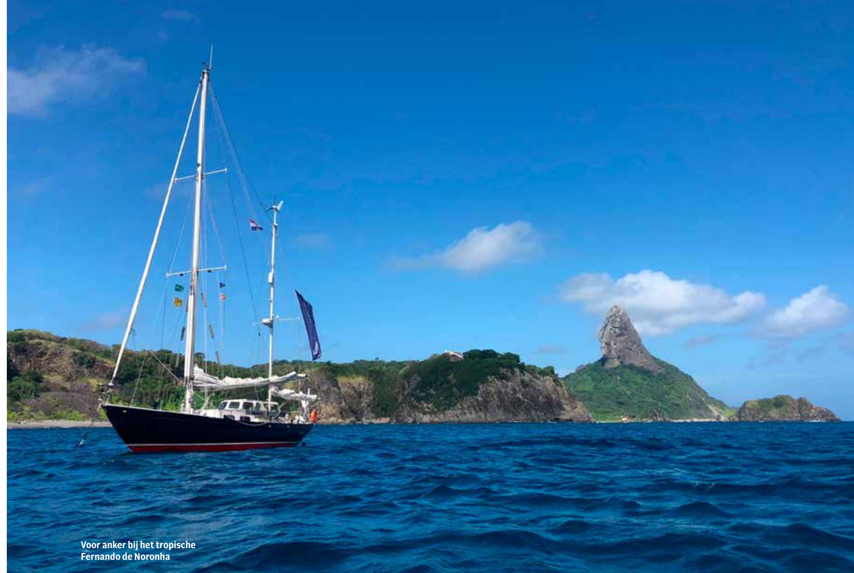
Voor anker bij het tropische Fernando de Noronha