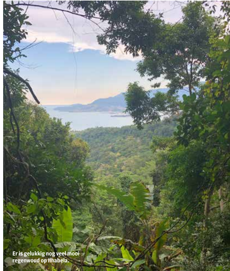
Er is gelukkig nog veel mooi regenwoud op Ilhabela.