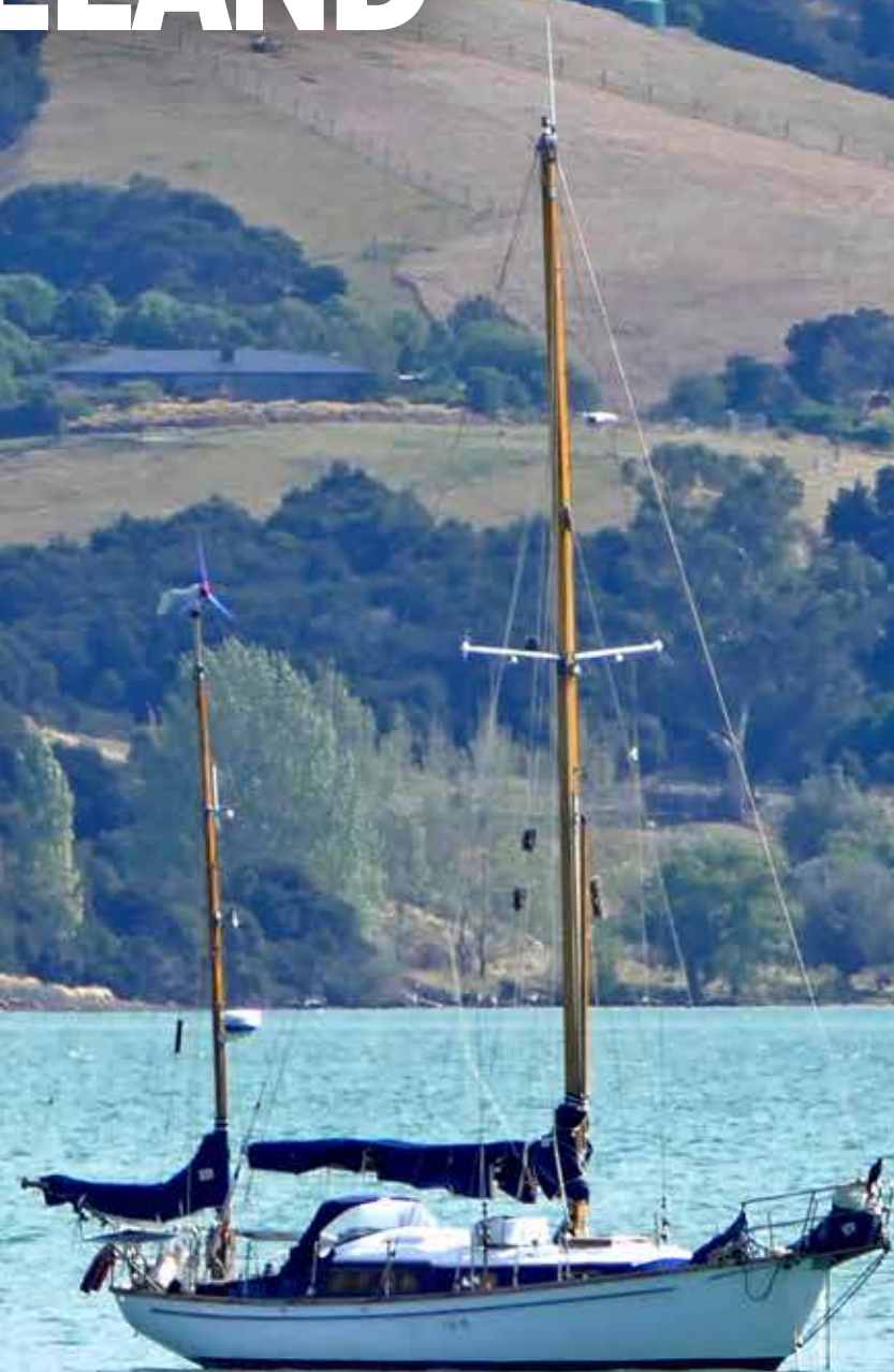
Duende gespot aan haar anker in Akaroa.